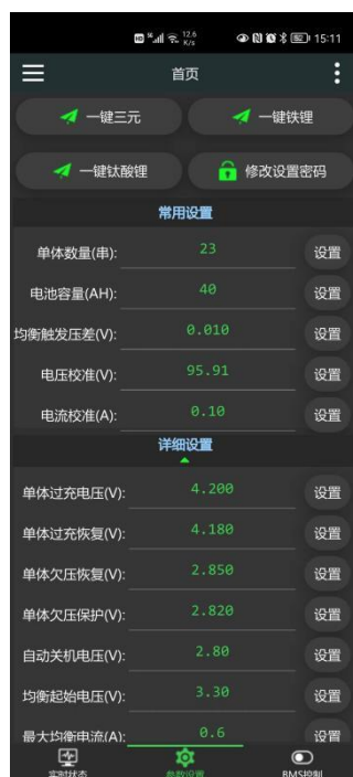
图7 参数设置页面显示

如果需要修改保护板的工作参数，必须先点击“ 授权设置 ”按钮，输入参数设置密码，