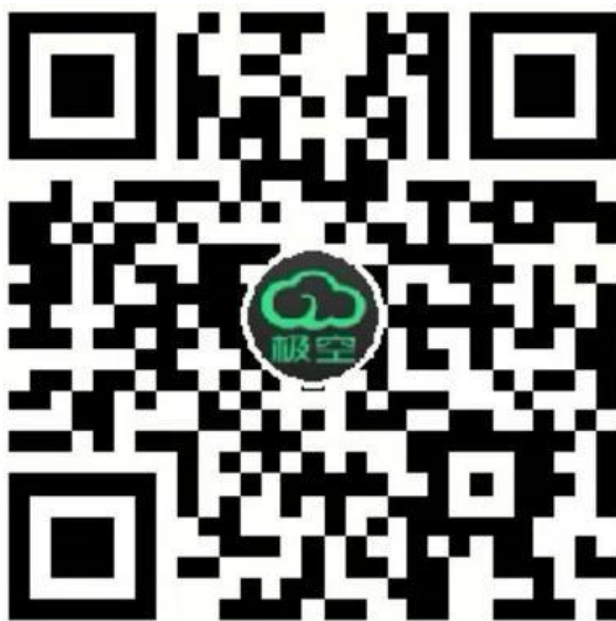
图 1 手机APP 链接二维码